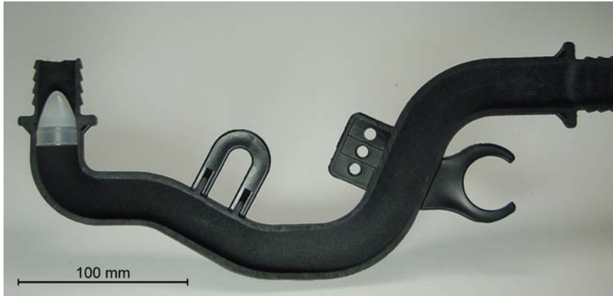
Darstellung des durch das Projektil ausgebildeten Hohlraums