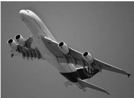
Schub für Deine Karriere – Hoher Anteil von Kunststoffen im Airbus A 380

Anschließend kann, wenn die Zulassungsvoraussetzungen erfüllt sind, mit einem Masterstudium begonnen werden. Dieses dauert an der RWTH Aachen in der Regel weitere drei Semester.