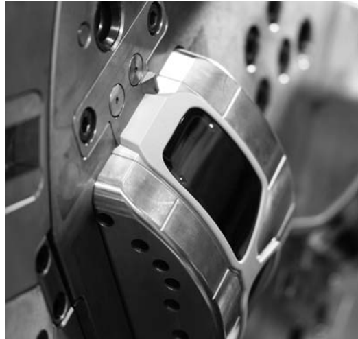
Komplexe Projekte angehen: 3-Komponenten Bauteil mit Leiterbahnen aus Metall im Kunststoffbrillenglas – eine Entwicklung des IKV

Diese Veranstaltung stellt eine Vertiefung der Vorlesung Kunststoffverarbeitung II dar. Ihr werdet in die Lage versetzt, komplexe Problemstellungen der Kunststoffverarbeitung in den Bereichen Spritzgießen, Extrusion und Faserverbundwerkstoffe zu analysieren, zu bewerten und zu lösen.