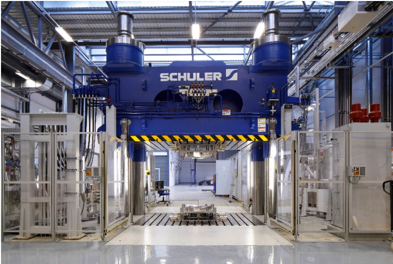
Bild 3: Großserienproduktionsequipment für SMC ist auch in der neuen Forschungseinrichtung des AZL auf dem RWTH Aachen Campus.