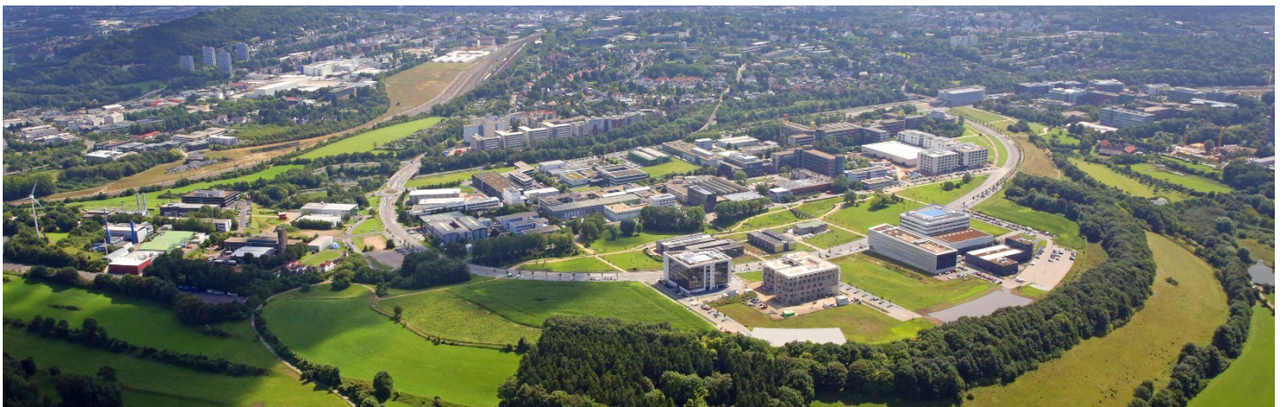
Bild 2: Kompetenzen und Hardware entlang der gesamten SMC-Prozesskette sind auf dem RWTH Aachen Campus vertreten.

Bild 1: Die 12-monatige Studie ist als Konsortialstudie konzipiert und bezieht Firmen entlang der gesamten Wertschöpfungskette ein. Teilnehmer profitieren somit vom Wissen aller Studienpartner und einbezogener Experten.